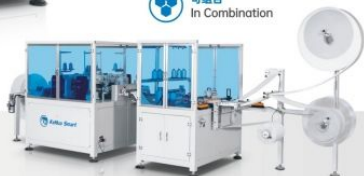
KH-DK104四头打点机+ KH-1500正反双头锁边机